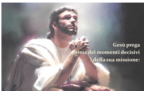
Gesù prega prima dei momenti decisivi della sua missione:

Gesù ha nominato spesso il nome del Padre: lo ha pregato, lo ha invocato. Ci ha insegnato a rapportarci con Lui allo stesso modo, chiamandolo: “Padre nostro”. Questo comandamento, letto al positivo, ci dice: “Nomina spesso il santo Nome di Dio, come ha fatto Gesù! Con grande rispetto e adorazione. Cioè come preghiera, come ascolto della sua Parola, come lode”. Dio non va nominato in ogni momento.